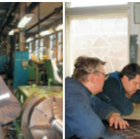
«Рабочие и газета "Уральский металлург"», Куимов Е.В. (энергетический цех), 2011г.