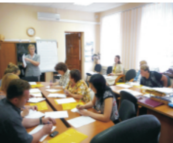
Семинар для председателей профкомов структурных подразделений по теме «Основы профсоюзной деятельности»