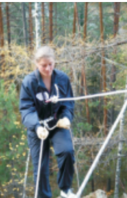
«Туристический слет. Гора Шихан: спуск», Павлова И.В. (ЦАЛ), 2008г.