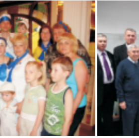
«Не расстанусь с комсомолом (90 лет ВЛКСМ)», Фрайштут С.Н., Мусаева Е.А. (ОТК)