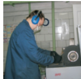
«Маленький кусочек металла на большие испытания», Парфенова Е.А. (ТМЛ), 2011г.