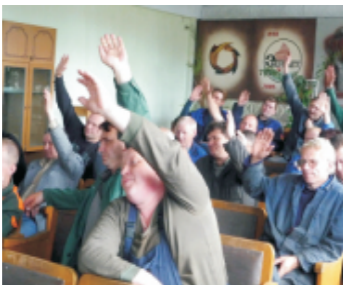
Выборы делегатов на заводскую отчетно-выборную конференцию в энергетическом цехе